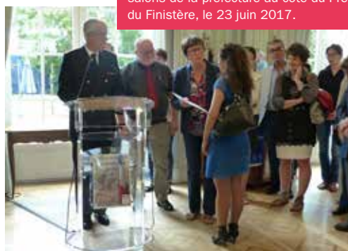
Cérémonie de naturalisation dans les salons de la préfecture au côté du Préfet du Finistère, le 23 juin 2017.