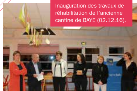
Inauguration des travaux de réhabilitation de l'ancienne cantine de BAYE (02.12.16).