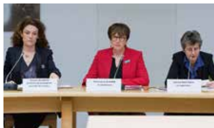
Conférence de presse présentant le rapport sur les « variations du développement sexuel : lever un tabou, lutter contre la stigmatisation et les exclusions » (07.03.17).

La LDH de Quimper a organisé la projection d'un documentaire sur le sujet, suivi d'un débat.