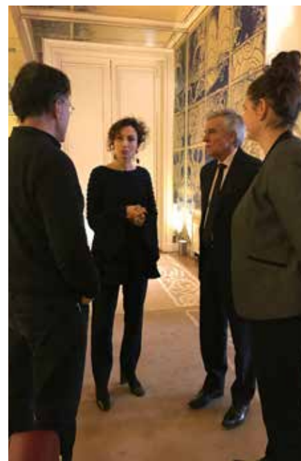
Avec la Ministre Audrey AZOULAY, pour défendre le projet porté par Le Groupe Ouest et valoriser l'impact territorial de la jeune structure installée à Plouñéour-Trez (21.03.17).