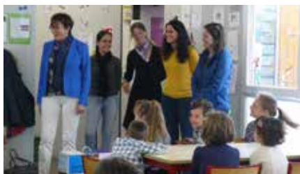
Remise d'une mallette pédagogique « Histoire des Arts » à l'école primaire publique Les Hirondelles de Tréogat (4.05.17).

Intervention en discussion générale sur le débat consacré à la mise en œuvre des rythmes scolaires dans les petites communes : rappel des difficultés financières et organisationnelles mais aussi de l'engagement des municipalités des petites communes pour exploiter les atouts de leurs territoires et proposer aux enfants des ateliers de qualité. La publication du décret du 27 juin 2017, ouvrant la possibilité d'un retour à quatre jours, a ravivé les débats et pressions, alors même que les conclusions du rapport sénatorial conjoint aux commissions des finances et de l'éducation votées à l'unanimité, confirmaient : le besoin d'en finir avec l'instabilité ; le maintien du principe de la réforme et la révision de l'an-