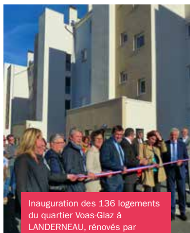
Inauguration des 136 logements du quartier Voas-Glaz à LANDERNEAU, rénovés par Finistère Habitat (03.10.16).