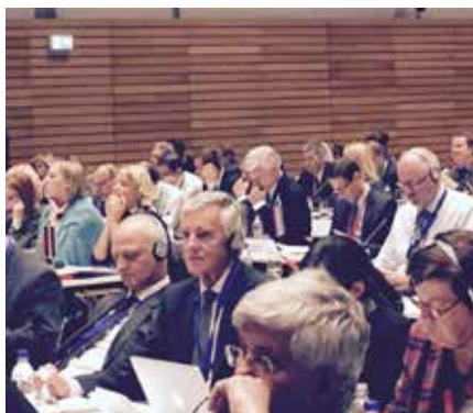
Conférence interparlementaire des 28 États européens sur la stabilité, la coordination économique et la gouvernance au sein de l'UE à Bratislava, la Slovaquie assurant alors la présidence de l'Union européenne (17-18.10.16).