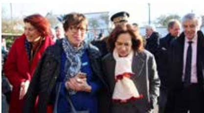
Déplacement de Laurence ROSSIGNOL, Ministre des Familles, de l'Enfance et des Droits des femmes, à Brest pour une rencontre avec les collégiens ambassadeurs du label « Respect Zone » dans le cadre d'un programme de lutte contre le harcèlement à l'école (10.02.17).

de communes seulement) et de l'Assainissement.