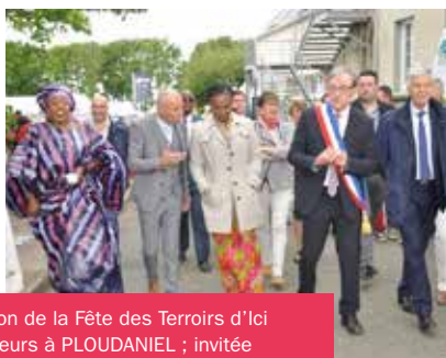
7 e édition de la Fête des Terroirs d'Ici et d'Ailleurs à PLOUDANIEL ; invitée d'honneur : LA CÔTE D'IVOIRE (20.05.17).