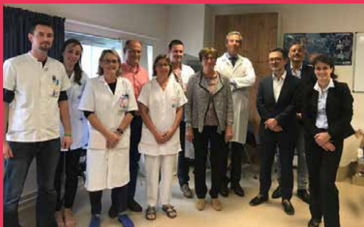
Visite de l'Unité Neuro-Vasculaire du CHRU de Brest avec l'ensemble des équipes du professeur TIMSIT dédiées à la prise en charge de l'AVC (29.05.17).

Autre chantier important qui a mobilisé les membres des Conférence de territoires 1 et 2 et qui a suscité beaucoup d'inquiétudes et de craintes : les Groupements Hospitaliers de Territoires.