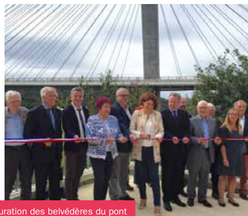
Inauguration des belvédères du pont de Térénez à ROSNOËN (26.09.16).