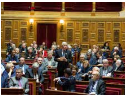
Dans le cadre de la question d'actualité du 03.11.16 sur la redistribution fiscale, Michel SAPIN, alors Ministre de l'Economie et des finances, a apporté un éclairage sur les mesures prises pour renforcer encore la progressivité de l'impôt.

Touchant à la vie des collectivités locales, diverses questions ont par ailleurs été posées sur : l'assiette de la taxe d'aménagement, les indemnités pour frais de représentation des maires, la taxe de séjour appliquée aux plateformes Internet, la délégation de gestion d'un établissement public de coopération intercommunale vers une commune, la taxe sur les friches commerciales, les mutuelles communales.